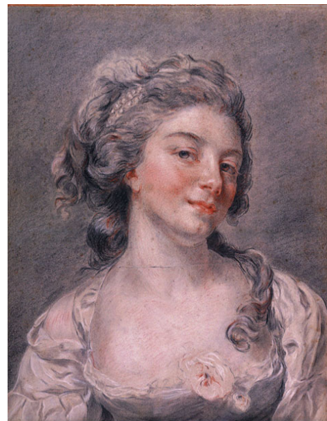
2.マリー＝ジュヌヴィエーヴ・ブリアール 《自画像》