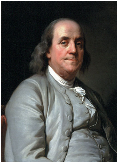
ジョゼフ・シフレッド・デュプレッシス