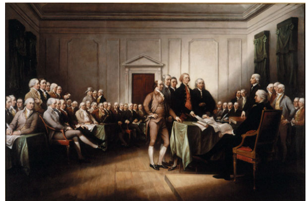
ジョン・トランブル 《独立宣言》 1832年 ワッズワース・アセニウム美術館、ハートフォード、CT Purchased by Daniel Wadsworth and Members of the Atheneum Committee

アメリカン・ヒーロー、この言葉を耳にしたことがある人は多いことと思います。アメリカほど英雄とともに語られている国はほかにはありません。実際、タイトルに「アメリカン・ヒーロー」という言葉が付された本は、日本でも数多く出版されています。このことは、アメリカを理解するにあたって、英雄やヒロイズムといった問題が欠かすことのできないものであることを示しています。では、英雄とはなんのでしょうか。それは神話と結びついています。アメリカは、多くの英雄を作り出し、その英雄による国家の歴史の神話を語ってきました。そして、我々のアメリカ理解も、そのような英雄神話のフィルターを抜きにすることはできません。このような視点から、今回の展覧会は企画されています。