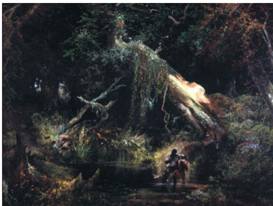
トーマス・モラン 《奴隷狩り、ヴァージニア州ディズマル湿地》 1862年 フィルブルック美術館、タルサ、OK Gift of Laura A.Clubb, 1947

本年は、サンフランシスコ講和条約締結50周年にあたる年です。戦後日本のアメリカとの深い関係、いい意味でも悪い意味でも戦後社会のアメリカナイゼーションを振り返ってみるには、まさにうってつけの年ではないでしょうか。アメリカからの大きな影響のもとに築きあげられた戦後日本の社会システムが疑問に付され、日本が大きな岐路に立つ一方で、規制緩和や自己責任、情報技術革新など新たな社会システムの問題が、またアメリカからの影響のもとに日本に押し寄せています。このような状況のなかでは、アメリカ文化をどう理解するか、という問題を今一度検討してみることを、避けて通ることはできないと思います。社会と文化とは、分かち難く結びついているものなのです。本展が、単なるアメリカ礼賛でなく、そのような問題を考えてみるためのきっかけとなることを願っており