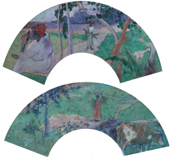
3.ポール・ゴーガン 《ラ・マルティニック島の情景》 1887年