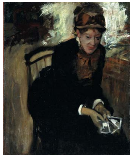
エドガー・ドガ 《メアリー・カサット》 1880-84年頃 スミソニアン・ナショナル・ポर्टレート・ギャラリー