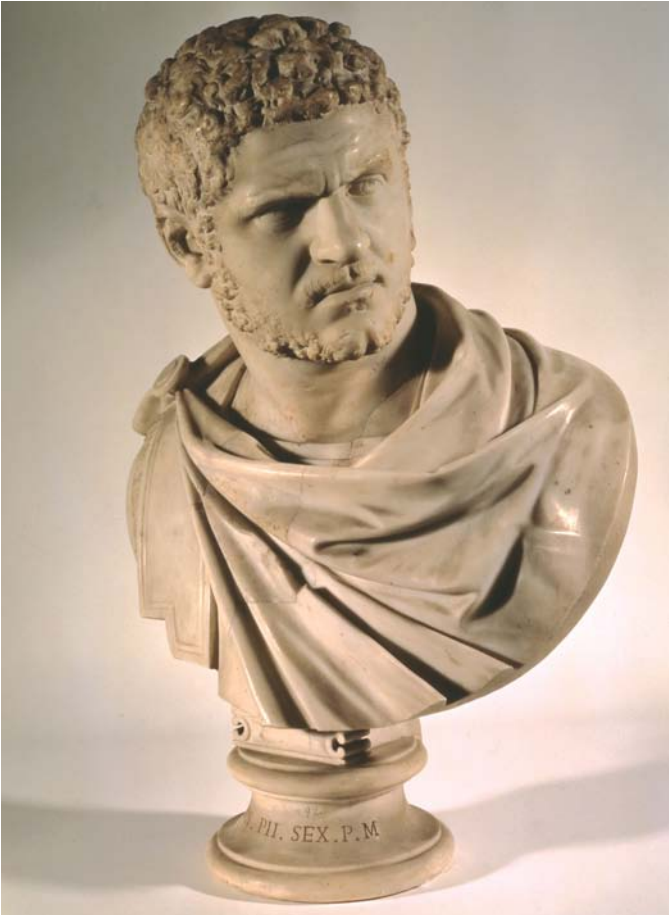
《カラカラ帝の胸像》 紀元後212-217年 ヴァチカン美術館蔵