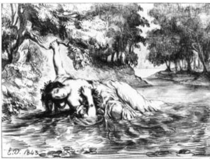
ウジェーヌ・ドラクロワ 《オフィーリアの死》 シェイクスピア「ハムレット」による連作より 1843年 リトグラフ

今回西洋美術館では、まとまって目にする機会の少ないこれら二つの連作を同時に展示いたします。ゲーテとシェイクスピアと