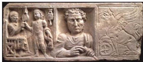
《鏡屋の肖像の表された墓碑浮彫》 紀元200-220年頃 ヴァチカン美術館蔵

そして素朴な初期キリスト教徒たちが、この世界に残した慎ましやかな「生きた証」ばかりです。