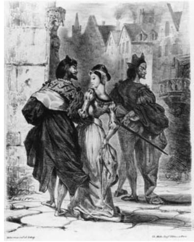
ウジェーヌ・ドラクロワ 《マルガレーテを誘惑しようとするファウスト》 ゲーテ「ファウスト」による連作より 1828年 リトグラフ

ドイツ人アロイス・ゼネフェルダーによるリトグラフ(石版画)の発明は、版画史上画期的な出来事でした。それまでも木版や銅板エングレーヴィングなどの技法による版画は、芸術作品であるとともに、絵画の複製手段としても大きな役割を果たしていました。しかしこの石版による技法の発明により、絵画的な手法がそのまま作品