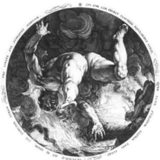
ヘンドリック・ホルツィウス 《イクシオン》 エングレーヴィング 1588年