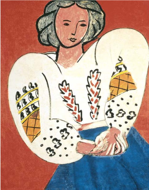
《ルーマニアのブラウス》 1940年 油彩／カンヴァス ポンピドゥーセンター・国立近代美術館 © 2004 Succession H. Matisse, Paris / SPDA, Tokyo