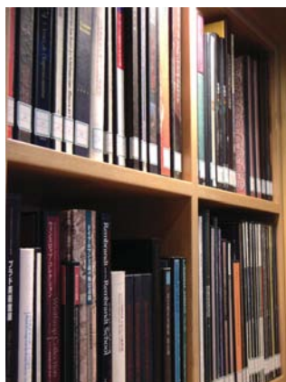
資料コーナーに置いてある 開架資料一部