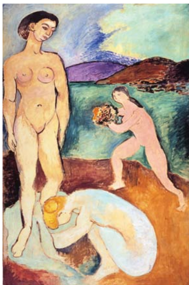
《豪奢 I》1907年 油彩／カンヴァス ポンピドゥーセンター・国立近代美術館 © 2004 Succession H. Matisse, Paris / SPDA, Tokyo