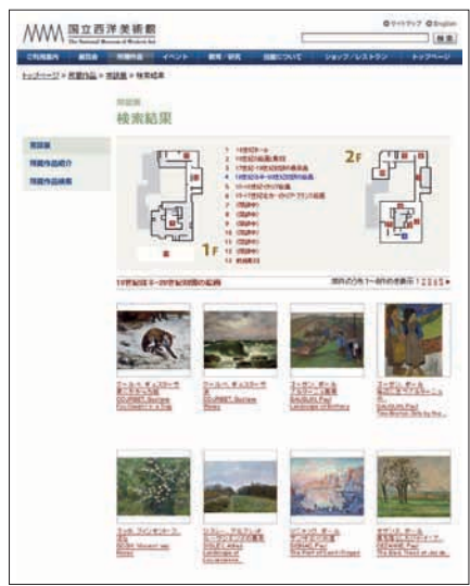
「常設展」メニューの画面 http://collection.nmwa.go.jp/artizeweb/search_5_area.do