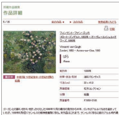
作品の詳細画面 (図版の下に展示場所が表示されています。)