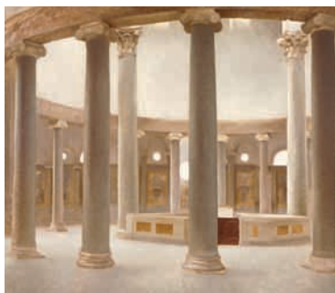
ヴィルヘルム・ハンマースホイ 《ローマ、サント・ステファノ・ロンド聖堂の内部》 1902年 油彩/カンヴァス 67.3×72.8cm オーデンセ市立美術館