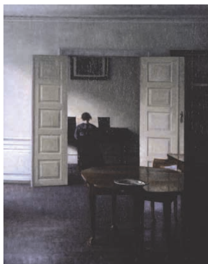
ヴィルヘルム・ハンマースホイ 《ピアノを弾くイーダのいる室内》 1910年 油彩/カンヴァス 76×61.5cm 国立西洋美術館

ロンドン展では70点ほどの展示となりますが、東京展では約90点のハンマースホイ作品に、同時期に活躍したデンマーク室内画派のピーダ・イルステズ(1861-1933)とカール・ホルスーウ(1863-1935)の18点を加えた総数100点を越す大規模な回顧展となります。ロンドン展が編年的な会場構成をとったのに対し、東京展ではハンマースホイが繰り返し描いた主要モチーフに焦点を合わせた主題別のセクション構成となっています。