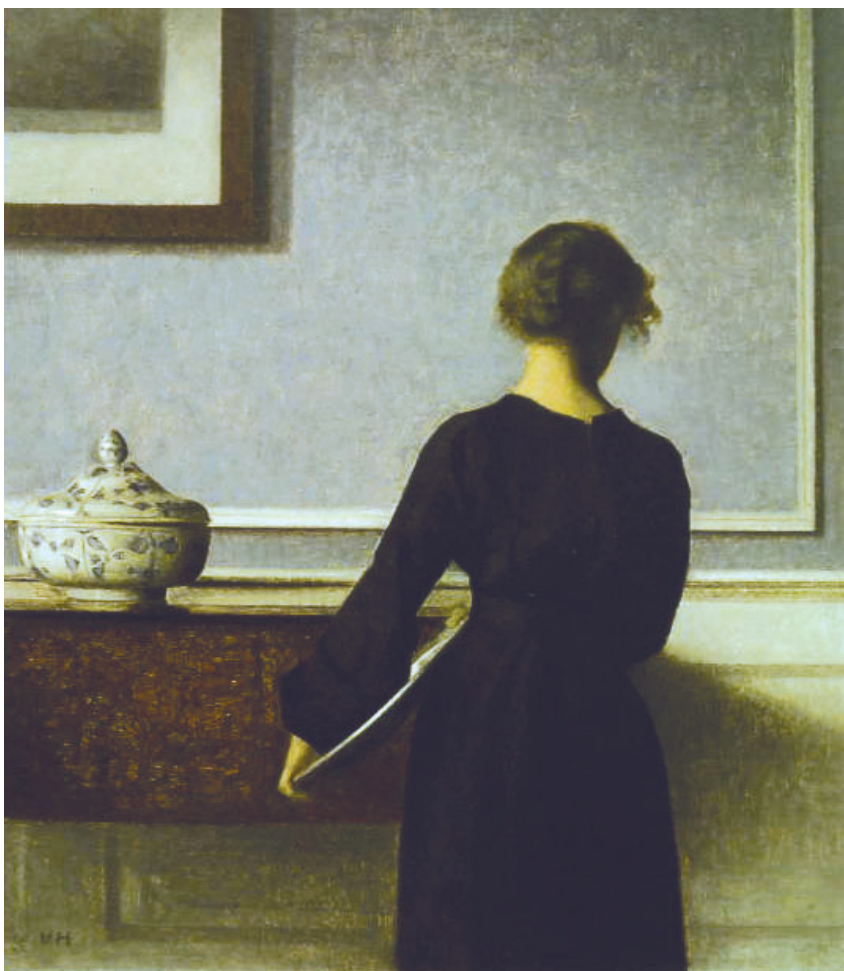
ヴィルヘルム・ハンマースホイ《背を向けた若い女性のいる室内》 1904年頃 油彩/カンヴァス 61×50.5cm ラナス美術館