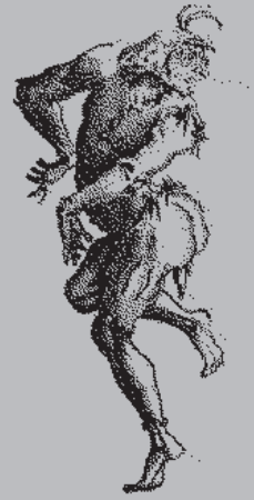
ジャック・カロ《二人のザンニ》(部分)、1616年頃