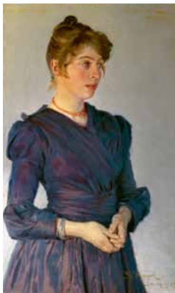
ペーダー・セヴェリン・クロヤー 《マリー・クロヤーの肖像》1889年、ステインビヤーにて）1889年