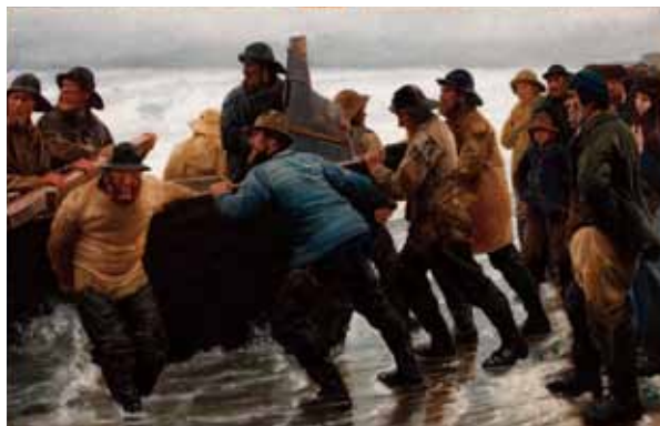
ミカエル・アンカー 《ボートを漕ぎ出す漁師たち》1881年