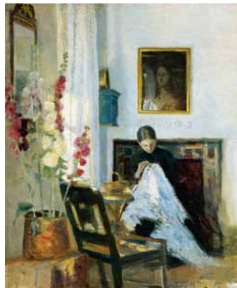
マリー・クロヤー 《縫い物をする女性のいる室内》制作年不詳