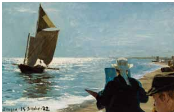
ペーダー・セヴェリン・クロヤー 《スケーエンの南海岸の画家たち》1882年