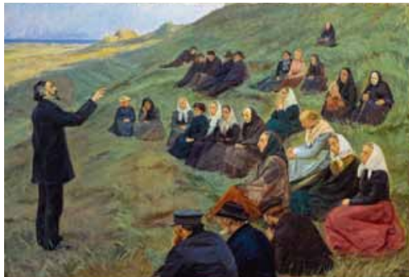
アンナ・アンカー 《戸外の説教》1903年