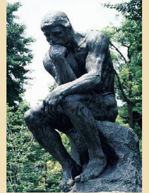
오귀스트 로댕《생각하는 사람(확대작)》 1881-82년(원형), 1902-03년(확대) 마스카타 컬렉션