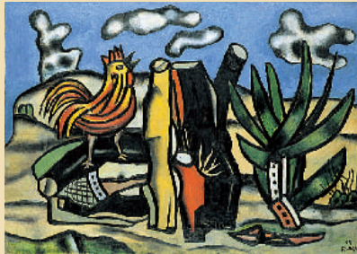
페르낭 레제《빨간 수탉과 파란 하늘》1953년

드로크로와·쿠르베, 밀레, 부댕, 마네, 모네, 피사로, 르누아르, 세잔, 고갱, 고흐, 시나크 등 19세기부터 20세기 초반까지의 프랑스 미술사를 대표하는 화가들의 작품을 볼 수 있습니다. 이 시대에는 사회가 근대화되면서, 회화에도 그때까지 없던 다양한 표현을 볼 수 있게 됩니다. 본 미술관의 마스카타 컬렉션은 이 시대의 작품을 중심으로 하고 있습니다. 도니, 코테, 아망=장, 말탄, 메나르 등 인상파 이외의 화가들의 작품도 다수 포함하고 있는 것이 특징 중의 하나입니다. 이들 화가의 작품을 통해 마스카타 코지우 씨가 유럽에서 수집활동을 하고 있던 1910~20년대 당시의 프랑스 화단의 모습을 알 수 있습니다.