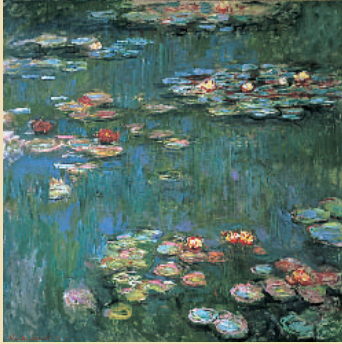
클로드 모네《수련》1916년 마스카타 컬렉션