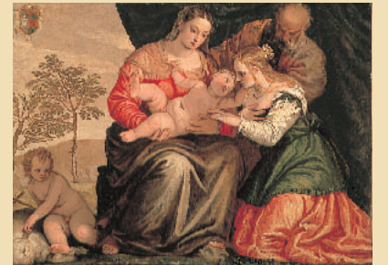
파올로 베로네세《성 카타리나의 신비한 결혼》1547년 경

19세기 후반부터 20세기 초기까지의 프랑스 조각을 중심으로 소장하고 있습니다. 특히 로댕의 작품들은 세계에서 유수의 컬렉션으로 《코가 으깨진 남자》, 《청동시대》 등의 초기 작품에서부터 《입맞춤》, 《생각하는 사람》, 《발자크》, 《지옥의 문》 등 중기 및 후기 작품에 이르는 대표작 대부분을 망라하고 있습니다. 또한 같은 프랑스 조각가인 카르포우, 부르델, 마올 등 로댕 전후로 활약한 작가의 작품도 소장되어 있습니다.