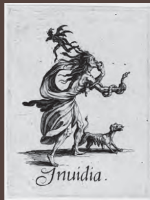
《嫉妬》(七つの大罪)連作より 1620年頃 エッチング、エングレーヴィング