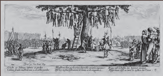
《絞首刑》(戦争の悲惨(大))連作より 1633年出版 エッチング