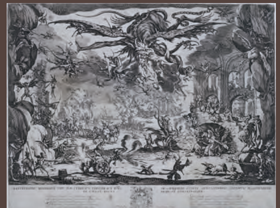
《聖アントニウスの誘惑》(第二作) 1635年出版 エッチング