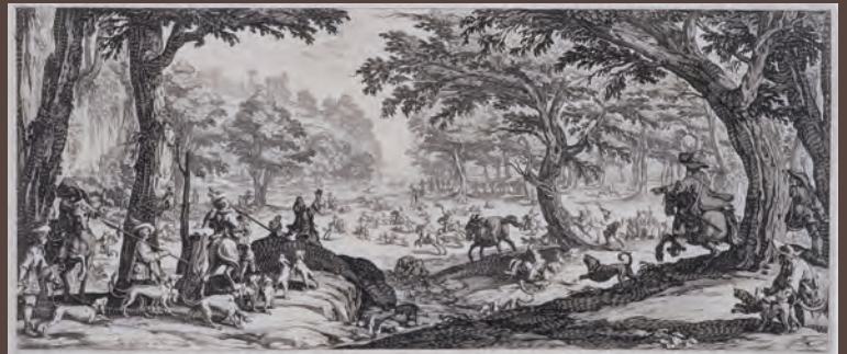
《狩り》 1620年頃? エッチング