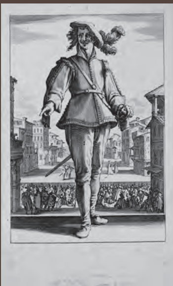
《カビターノ(あるいは恋人役)》(三人のパンタローネ)連作より 1610年代後半 エッチング、エングレーヴィング