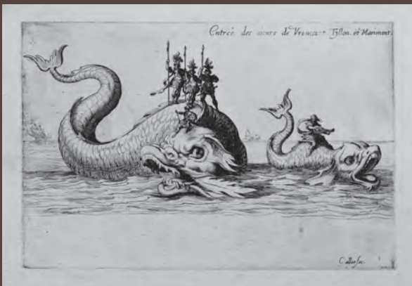
《ド・ヴロンクール殿、ティオン殿、マリモン殿の入場》(槍試合)連作より 1627年出版 エッチング