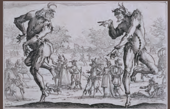
《二人のザンニ(喜劇の従者役)》 1616年頃 エッチング