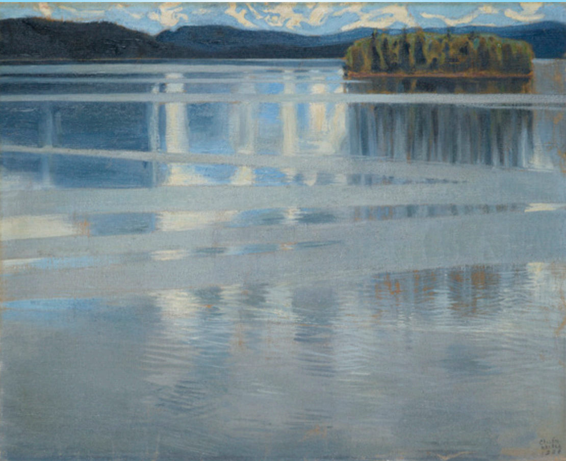
62 アクセリ・ガッレン＝カッレラ 《ケイテレ湖》1906年 油彩・カンヴァス 国立西洋美術館