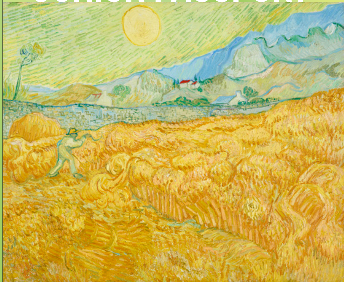
84 フィンセント・ファン・ゴッホ《刈り入れ(刈り入れをする人のいるサン＝ポール病院裏の麦畑)》(部分) 1889年 油彩・カンヴァス フォルクヴァング美術館