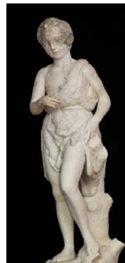
《若き洗礼者ヨハネ》 ミケランジェロ・ブオナローティ 1495-96年 ウベダ、エル・サルバドル聖堂、ハエン(スペイン)、 エル・サルバドル聖堂財団法人蔵

Firenze, Museo Nazionale del Bargello / On concession of the Ministry of cultural heritage and tourism activities