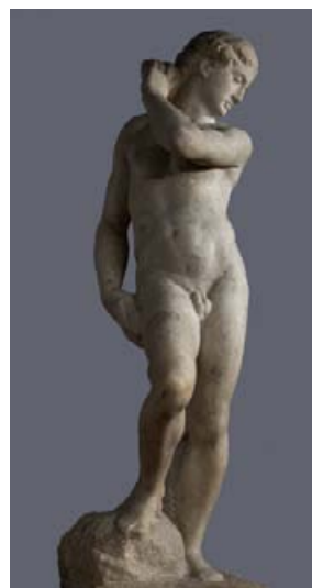
《ダヴィデ=アポロ》 ミケランジェロ・ブオナローティ 1530年頃 フィレンツェ、バルジェッロ国立美術館蔵

https://artexhibition.jp/michelangelo2018/