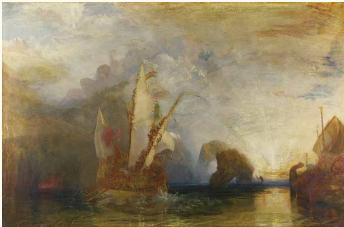
No.49 ジョゼフ・マロード・ウィリアム・ターナー 《ポリュフェモスを嘲るオデュッセウス》 1829年 油彩・カンヴァス © The National Gallery, London. Turner Bequest, 1856

フ コには、ギリシャ神話の英雄オデュッセウスの物語が描かれています。二そうの船の上にたくさんの方が乗っています。トロイア戦争に勝利したオデュッセウスは、船で部下たちと故郷のギリシャに帰る途中、一つ目の巨人が住む島に来てしまいました。巨人の一人、ポリュフェモスのほら穴に閉じ込められますが、オデュッセウスは知恵をしばって、ポリュフェモスの一つ目をつぶしました。そして仲間たちと脱出して船に戻り、海へとこぎ出しました。