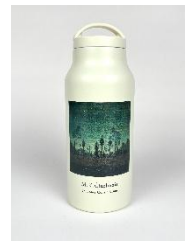
サーモボトル 500ml 4,730円(税込)

※画像は一部グッズのイメージです。実際の商品とは異なる場合があります。 ※商品ラインナップ、商品名、価格、デザイン、仕様、購入個数制限は変更になる場合があります。