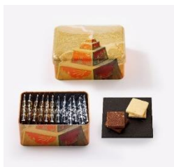
黒船 ノボタイル (M. K. チュルリョーニス《祭壇》缶) 2,484円(税込)