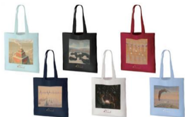
カラーバリエーショントートバッグ 6種類 2,750円(税込)

出品作品をあしらったトートバックやカステラを中心に展開するお菓子ブランド「黒船」の人気商品「ノボタイル」を詰め合わせた本展限定オリジナル缶のお菓子など、ここでしか手に入らない展覧会グッズが多数登場。その他、チュルリョーニスの祖国リトアニア関連の雑貨も販売予定です。ぜひ会場でお手に取ってご覧下さい。