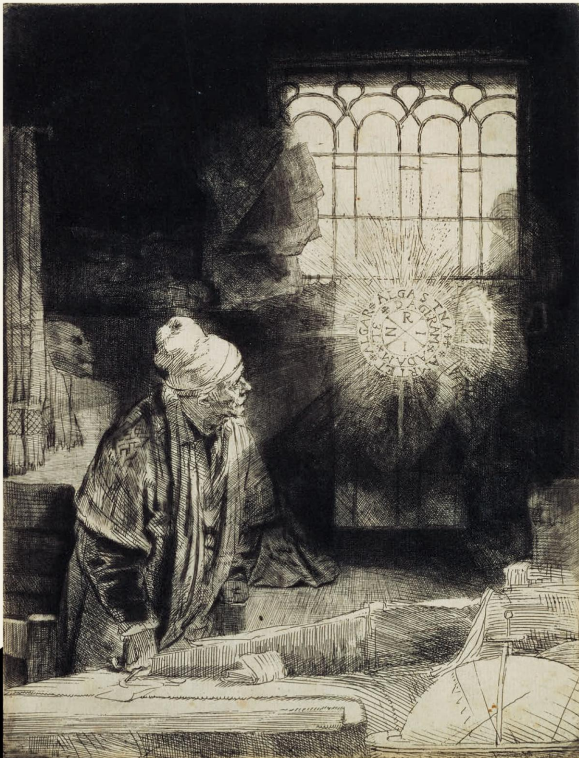
レンブラント・ハルメンスゾーン・ファン・レイン 《書齋の学者 (ファウスト)》 1652年頃 国立西洋美術館