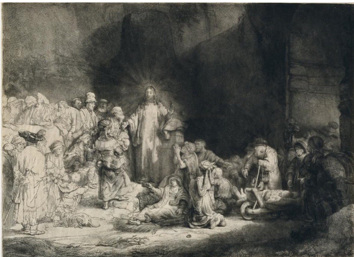
レンブラント・ハルメンスゾーン・ファン・レイン 《百グルデン版画》1648年頃 エッチング、ドライポイント、ビュラン／和紙 国立西洋美術館

『マタイによる福音書』19章に記された複数のエピソード——病人の癒し、パリサイ人たちの論争、子どもたちの祝福、富める若者への譴責——を、厳かに光を放つキリストを中心に、ひとつの画面の中で同時進行的に描いています。緻密に重ねた線の集積が生み出した柔らかく深い闇が支配する画面右側と、まるで白描のような趣の画面左側。この2つが共存する本作品は、エッチングが持つ表現の可能性が最大限まで追究された、レンブラントの手になるものにとどまらず、エッチング史においても屈指の傑作となっています。