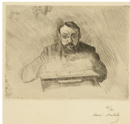
アンリ・マティス 《版画を彫るアンリ・マティス》1900-3年 ドライポイント 国立西洋美術館