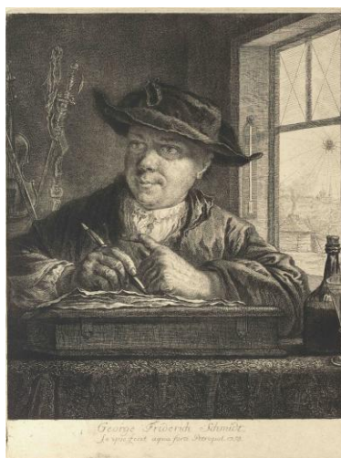
ゲオルク・フリードリヒ・シュミット 《窓の蜘蛛を伴う自画像》 1758年 エッチング、ドライポイント レンブラント・ハウス美術館