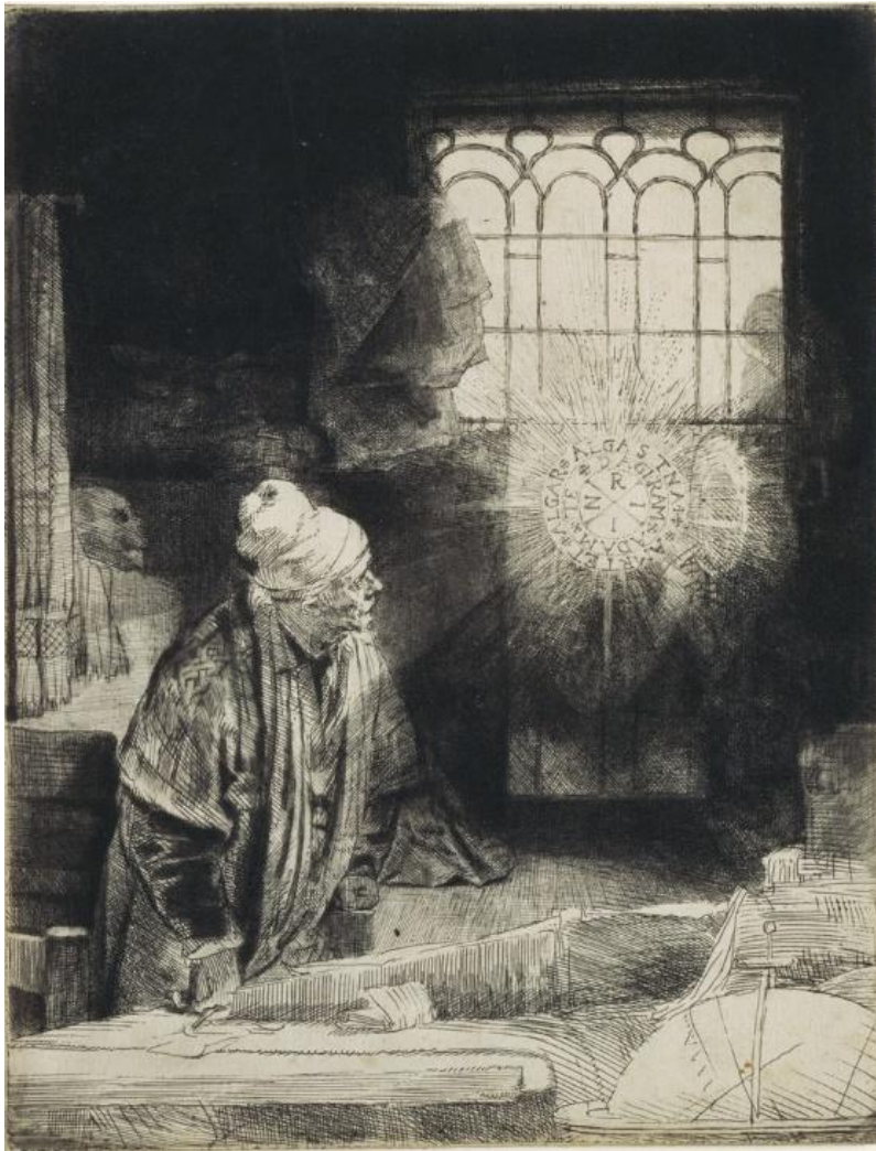
レンブラント・ハルメンスゾーン・ファン・レイン 《書斎の学者（ファウスト）》1652年頃 エッチング、ドライポイント、ビュラン 国立西洋美術館

《書斎の学者（ファウスト）》は、レンブラントによる最も謎めいた作品のひとつです。現在では、『コリントの使徒への手紙Ⅰ』に基づいて信仰の寓意が表されているという説が最も有力です。一方、19世紀には、この世のすべてを見極めたいという欲求から悪魔との取引すら厭わなかったファウストが、魔術に没頭する姿を描いたものと考えられていました。作品の謎めいた雰囲気は当時の人々の心をとらえ、さらにレンブラントのエッチングの代表例として、同技法の再評価を目指す作家たちによって称揚されました。エッチングの普及と地位向上を目指す『エッチングのパリ』誌の宣伝のために制作されたレガメのポスターは、そうした動きを結晶化させたものと言えるでしょう。