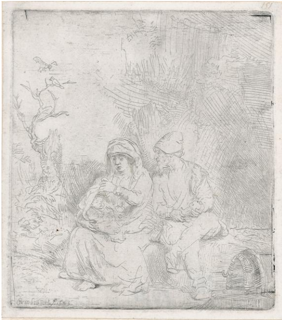
レンブラント・ハルメンスゾーン・ファン・レイン 《エジプト逃避途上の休息》1645年 エッチング、ドライポイント レンブラント・ハウス美術館

レンブラントは実験的精神に富んだ芸術家であり、エッチングにおいても様々な表現を試みました。聖家族のエジプト逃避を主題とした2点の作品のうち、1645年の作品では、ごく淡いスケッチ風の線描で画面を構成しています。一方、1651年の作品では、無数の線を重ねて、深い夜の闇を表現しています。