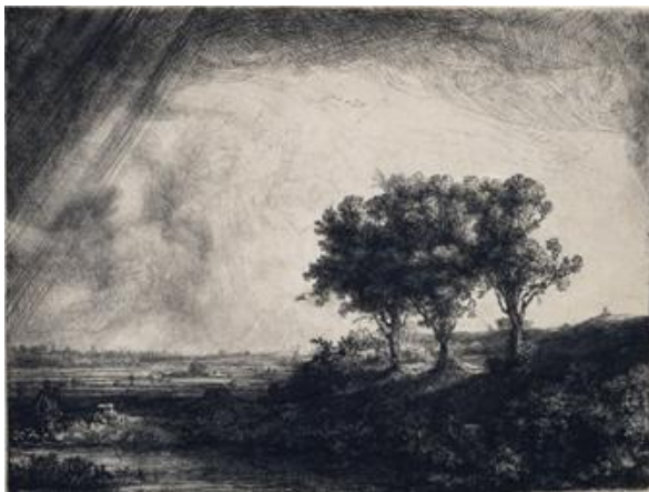
レンブラント・ハルメンスゾーン・ファン・レイン 《三本の木》1643年 エッチング、ドライポイント、ビュラン 国立西洋美術館