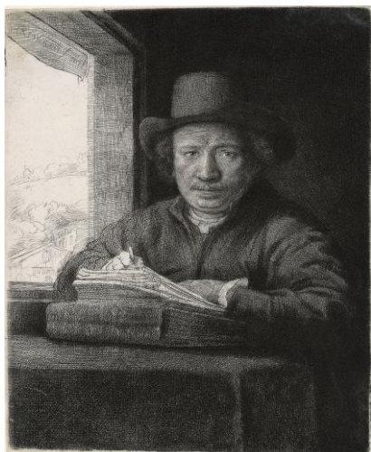
レンブラント・ハルメンスゾーン・ファン・レイン 《窓辺でエッチングを制作する自画像》 1648年 エッチング、ドライポイント、ビュラン/中国紙 レンブラント・ハウス美術館 ※2章にて展示