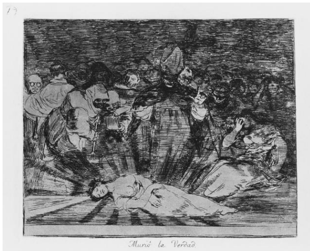
フランシスコ・ホセ・デ・ゴヤ・イ・ルシエンテス

ゴヤが活動した18世紀末から19世紀初頭のスペインで、レンブラントの版画はさほど知られていませんでしたが、彼は友人のコレクション等を通してそれらに親しんだと考えられます。ゴヤの作品には、しばしばレンブラントの版画からの着想が投影されています。「真理」の死（王政復古による「憲法の自由」の死の暗喩）を表した本作品もその一例で、構図やまばゆい光線の表現には、レンブラントの《使徒たちに現れるキリスト》とのつながりが見て取れます。