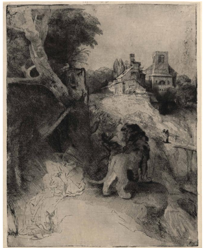
レンブラント・ハルメンスゾーン・ファン・レイン 《イタリア風景の中で読書する聖ヒエロニムス》 1653年頃 エッチング、ドライポイント/和紙 レンブラント・ハウス美術館