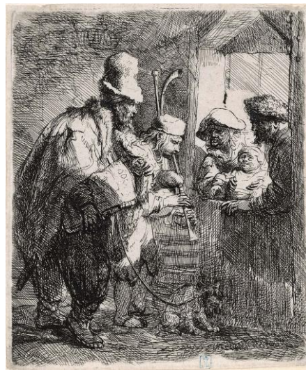
レンブラント・ハルメンスゾーン・ファン・レイン 《旅回りの楽師たち》1635年頃 エッチング レンブラント・ハウス美術館