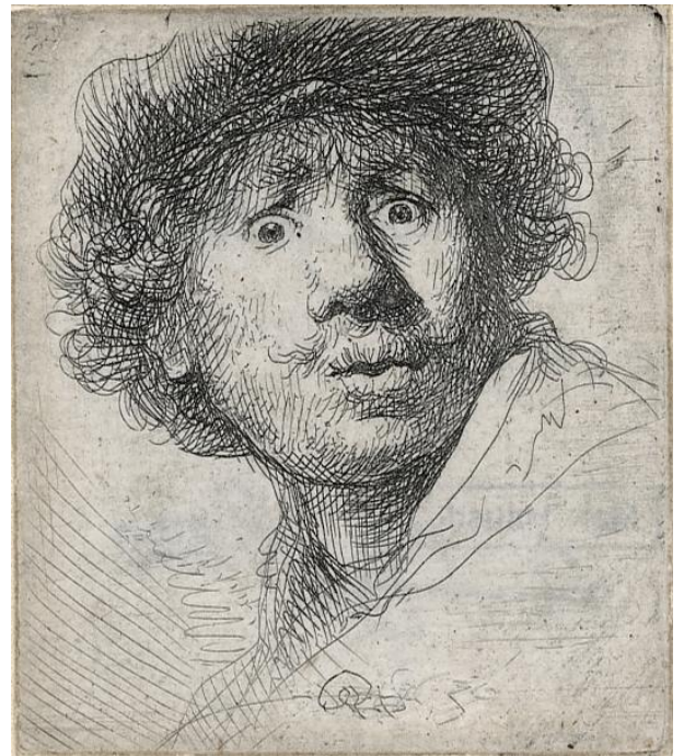
レンブラント・ハルメンスゾーン・ファン・レイン

レンブラントは、レイデンの裕福な製粉業者の家に生まれたものの、画家を志し、アムステルダムで有力画家ピーテル・ラストマンに学びました。修業後はレイデンで数年間、兄弟子ヤン・リーフェンスと工房を共有しますが、1631年にアムステルダムに戻り、肖像画家、物語画家として地位を築きます。しかし代表作《夜警》(アムステルダム国立美術館[アムステルダム市より寄託])を完成させた1642年以降、妻との死別や破産等、私生活上の不幸をたびたび経験します。また晩年に向かうにつれ、画風が時代の趣味と乖離していく憂き目にも見舞われました。浮き沈みのある人生の中で、絵画制作はしばしば停滞を見せますが、そのあいだもエッチング制作は継続されました。旺盛な実験精神のもと、膨大な数の作品の中でさまざまな表現を試み、それらは同時代、さらに後世の芸術家たちをも感化し続けることとなります。