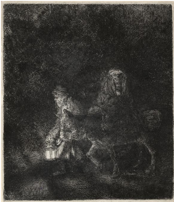
レンブラント・ハルメンスゾーン・ファン・レイン 《夜間のエジプトへの逃避》1651年 エッチング、ドライポイント レンブラント・ハウス美術館

レンブラントは実験的精神に富んだ芸術家であり、エッチングにおいても様々な表現を試みました。聖家族のエジプト逃避を主題とした2点の作品のうち、1645年の作品では、ごく淡いスケッチ風の線描で画面を構成しています。一方、1651年の作品では、無数の線を重ねて、深い夜の闇を表現しています。