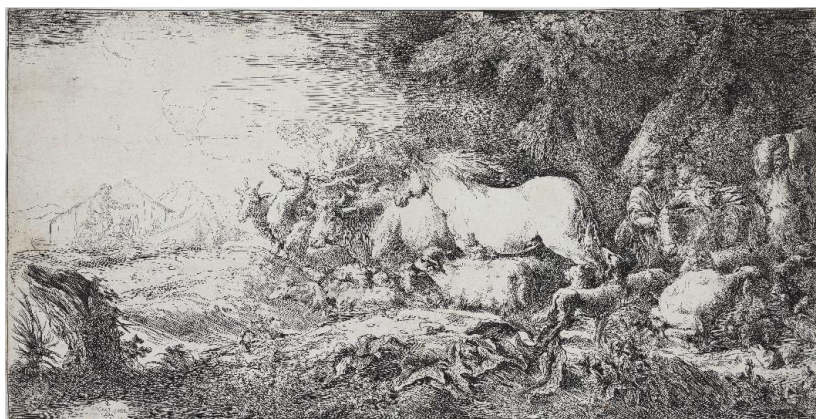
ジョヴァンニ・ベネデット・カスティリオーネ、 通称イル・グレケット 《箱舟に入るノアと動物たち》1650-55年 エッチング 国立西洋美術館

続く18世紀には、ドイツの芸術家たちを中心に、レンブラントのエッチングへの関心が高まります。数多くの模倣作が制作されたほか、レンブラントが未完で残した作品に手を入れて、「完成」させる動きも見られました。さらに、レンブラントのエッチングは、美術愛好家たちによっても熱心に収集され、今日のレンブラント研究につながるカタログ・レゾネ（全作品目録）の編纂も始まります。