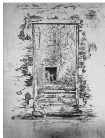
ジェイムス・マクニール・ホイッスラー 《庭》1886年 エッチング 国立西洋美術館