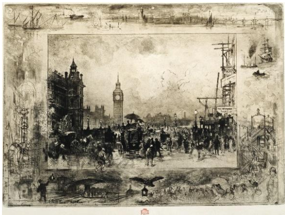
フェリックス・ビュオ 《ウェストミンスター・ブリッジないしウェストミンスターの時計塔》1884年頃 エッチング、ドライポイント、ルーレット 国立西洋美術館