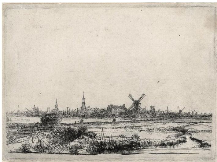
レンブラント・ハルメンスゾーン・ファン・レイン 《アムステルダム眺望》1641年頃 エッチング レンブラント・ハウス美術館