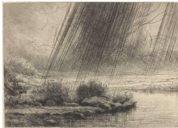
アルフォンス・ルグロ 《嵐の川景色》1857年 ドライポイント レンブラント・ハウス美術館