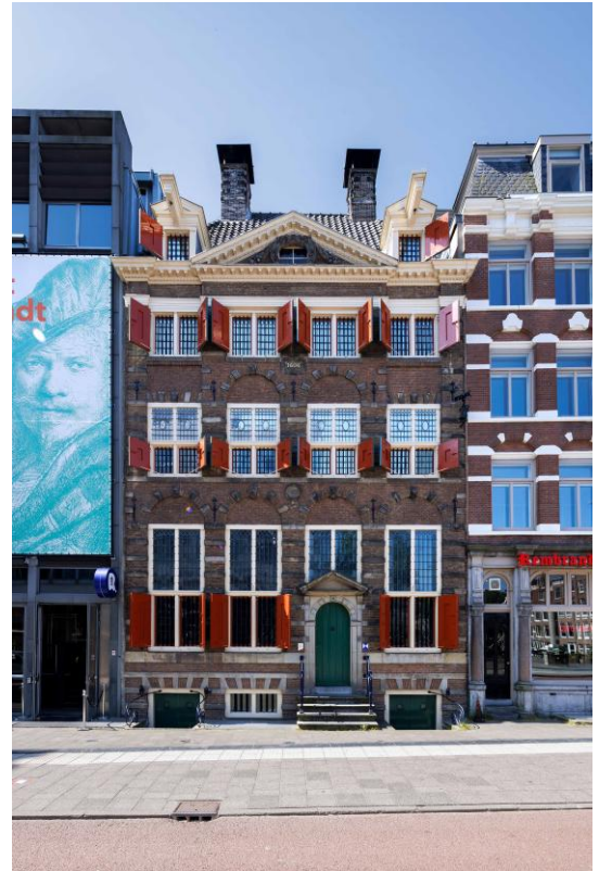
レンブラント・ハウス美術館外観

展覧会の前半では、まずレンブラントのエッチングに焦点をあてます。彼は当時、先例より刺激を受けつつ、さまざまな実験的な試みを通してエッチング表現の可能性を追究し、その地平を拓きました。そうして生み出された諸作品は、数世紀にわたって芸術家たちに影響を与え続けます。とくに、19世紀には、エッチング技法そのものの再評価と結びつき、レンブラントのエッチングへの関心は熱狂的な高まりをみせました。展覧会の後半では、そうした事例を、版画のみならず文学や批評なども交えてご紹介します。