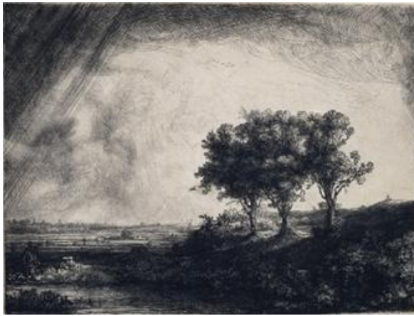
レンブラント・ハルメンスゾーン・ファン・レイン 《三本の木》1643年 エッチング、ドライポイント、ビュラン 国立西洋美術館