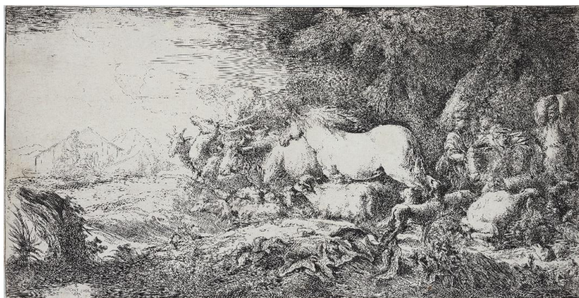
ジョヴァンニ・ベネデット・カスティリオーネ、 通称イル・グレケット 《箱舟に入るノアと動物たち》1650-55年 エッチング 国立西洋美術館

続く18世紀には、ドイツの芸術家たちを中心に、レンブラントのエッチングへの関心が高まります。数多くの模倣作が制作されたほか、レンブラントが未完で残した作品に手を入れて、「完成」させる動きも見られました。さらに、レンブラントのエッチングは、美術愛好家たちによっても熱心に収集され、今日のレンブラント研究につながるカタログ・レゾネ（全作品目録）の編纂も始まります。