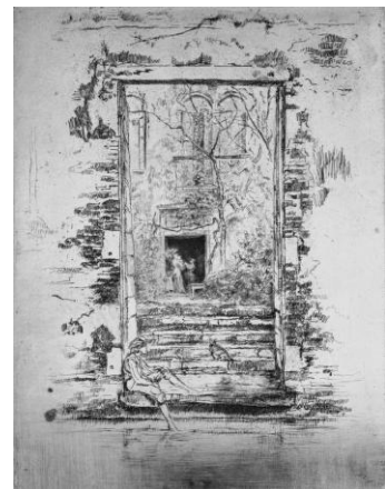
ジェイムズ・アボット・マクニール・ホイッスラー 《庭》1886年 エッチング 国立西洋美術館