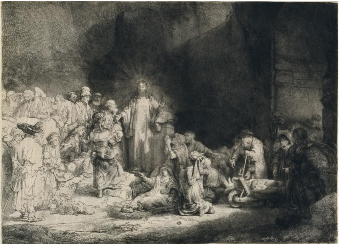
レンブラント・ハルメンスゾーン・ファン・レイン 《百グルデン版画》1648年頃 エッチング、ドライポイント、ビュラン／和紙 国立西洋美術館

『マタイによる福音書』19章に記された複数のエピソード——病人の癒し、パリサイ人たちの論争、子どもたちの祝福、富める若者への譴責——を、厳かに光を放つキリストを中心に、ひとつの画面の中で同時進行的に描いています。緻密に重ねた線の集積が生み出した柔らかく深い闇が支配する画面右側と、まるで白描のような趣の画面左側。この2つが共存する本作品は、エッチングが持つ表現の可能性が最大限まで追究された、レンブラントの手になるものにとどまらず、エッチング史においても屈指の傑作となっています。