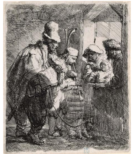
レンブラント・ハルメンスゾーン・ファン・レイン 《旅回りの楽師たち》1635年頃 エッチング レンブラント・ハウス美術館