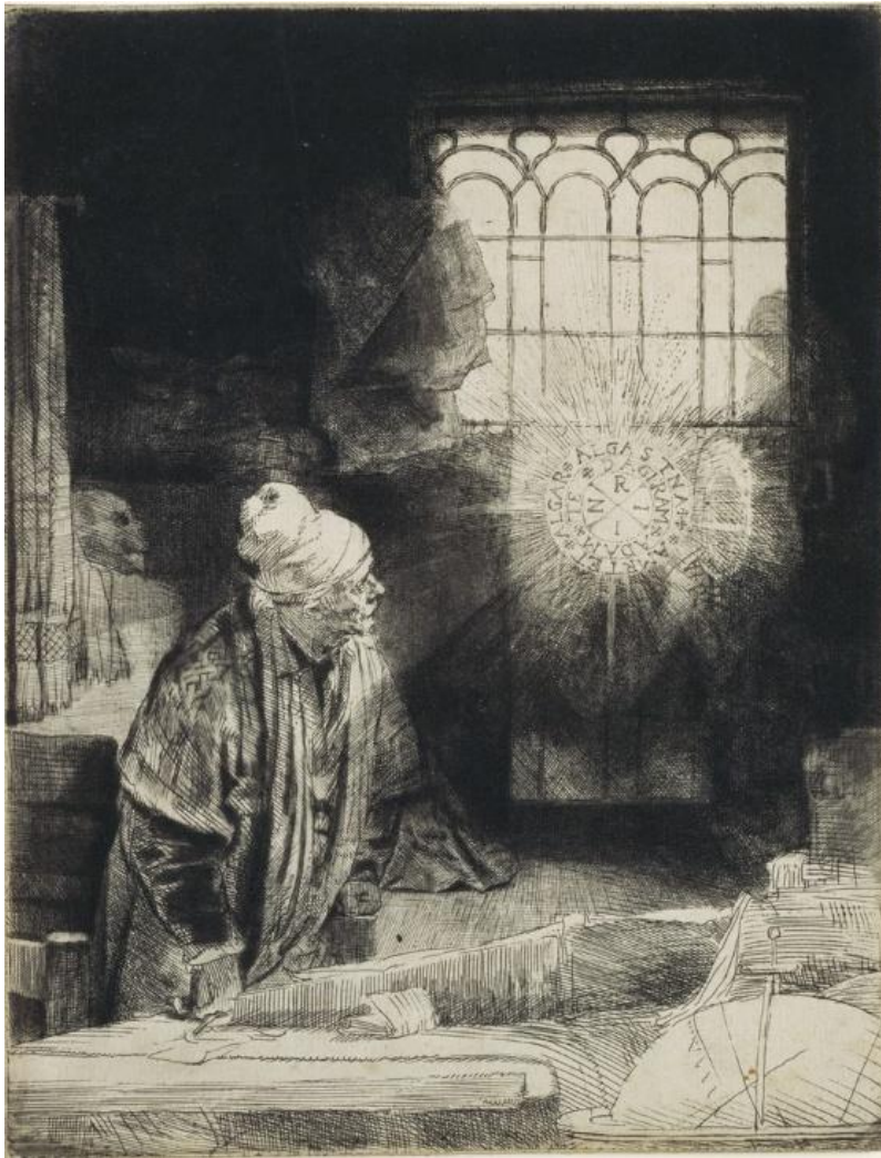
レンブラント・ハルメンスゾーン・ファン・レイン 《書斎の学者（ファウスト）》1652年頃 エッチング、ビュラン、ドライポイント 国立西洋美術館