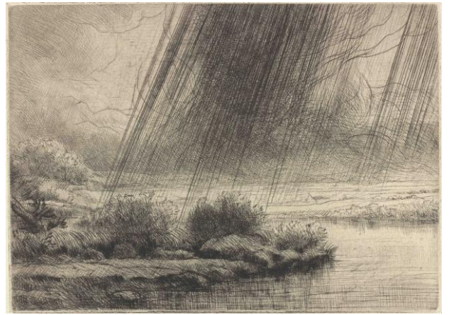
アルフォンス・ルグロ 《嵐の川景色》1857年 ドライポイント レンブラント・ハウス美術館